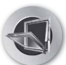
KOMFORT- OCH RÖKVENTILATION